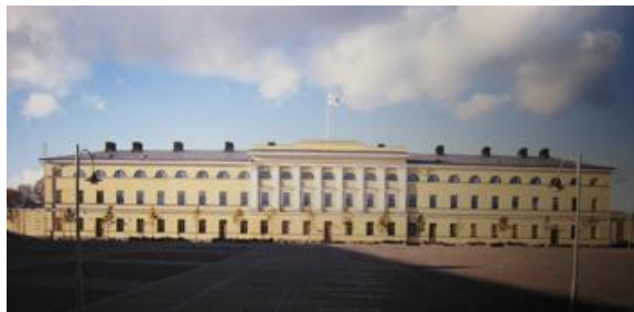
Merikasarmi/Ulkosivustot Carl Ludvig Engel 1816-1838/1989