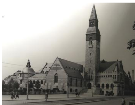
Suomen kansallismuseo Herman Gesellius, Armas Lindgren, Eliel Saarinen 1910