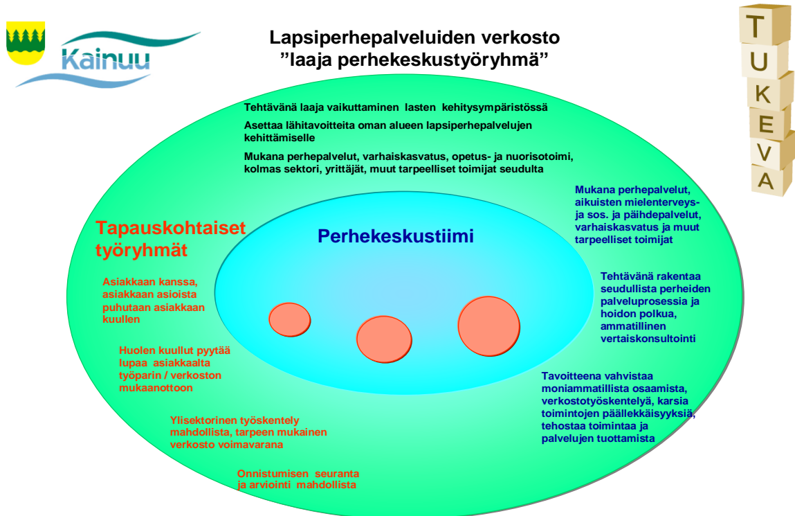
TUKEVA - Kainuun osahanke 2010

Hankkeen aikana perhekeskusten ja -asemien rakenne selkiintyi ja perhekeskuksiin ja –asemille muotoutui kolme tavoitteiltaan ja kokoonpanoltaan erilaista työryhmää; Laaja perhekeskustyöryhmä, perhekeskustiimi sekä tapauskohtaiset työryhmät. Perhekeskusrakennetta on kuvattu kuviossa 2. Hankkeen aikana perhekeskustyöryhmien kokoonpanoa laajennettiin mm. kolmannen sektorin, aikuispalvelujen ja varhaiskasvatuksen toimijoilla. Kajaanin alueelle perustettiin myös kolme uutta perhekeskustiimiä Teppanaan, keskustan alueelle ja Lohtajalle. Kainuussa on nyt 12 perhekeskustiimiä.