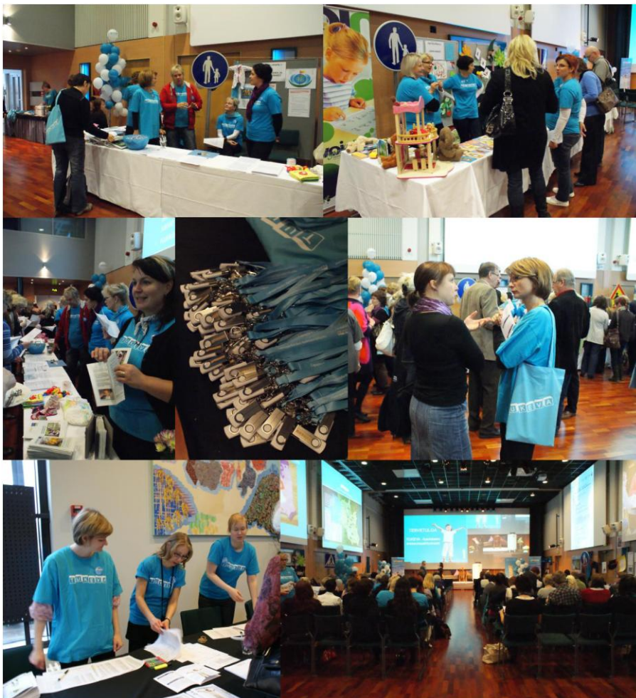
Kuva 1: TUKEVA-päätösmessutapahtuma 22.9.2010 Oulussa

TUKEVA-hankkeen viralliset päätösmessut järjestettiin 22.9.2010 Oulussa Kokouskeskus Lasaretissa. Asiantuntijapuheenvuorojen, panelikeskustelujen, tietoisuuksien sekä muun ohjelman lisäksi osallistujille jaettiin mm. TUKEVA-muistitikut. Muistitikkuihin oli kerätty runsaasti hankkeessa tuotettua materiaalia, kuten esitteitä, prosessikuvauksia, pilottien raportteja sekä käytännön työkaluja, kuten hankkeessa kehitettyjä arviointi- ja tiedonsiirtomakkeita, kutsuja, ohjeita, oppikurssien sisältöjä, palautelomakkeita jne. Päätösmessuille osallistui n. 170 henkilöä Pohjois-Suomen alueelta (kuva 1).