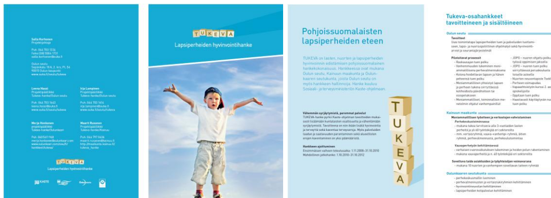
Kuva 2: TUKEVA-hankkeen yleisesite

Lisäksi hankkeen toiminnasta on tiedotettu laajasti eri yhteistyötahojen kokouksissa ja hankkeessa kehitettyjä toimintamalleja on esitelty useissa seminaareissa valtakunnallisesti ja alueellisesti. Hankkeeseen on myös tuotettu tiedotuksen tukimateriaalia kuten esitteitä, quick screenejä, postereita, kyniä, avainnauhoja, seminaarikansioita, muistitkkuja ja t-paitoja (kuvat 1 ja 2).