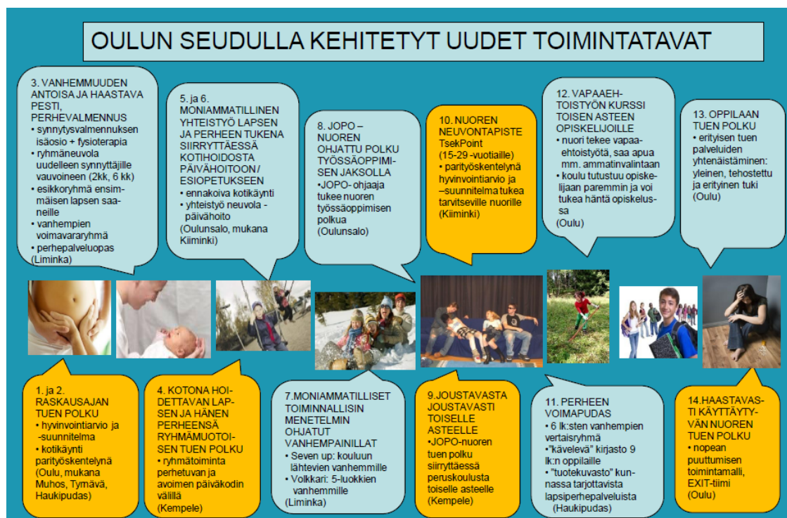
Kuvio 1: Oulun seudulla kehitetyt ja pilotoidut uudet toimintamallit. Oranssilla värillä TUKEVA 2 -jatkohankkeeseen laajemmin juurrutettaviksi valitut viisi toimintamallia.

Oulun seudun osahankeessa oli kaksi keskeistä toimenpidekokonaisuutta; uusien toimintatapojen kehittäminen lapsiperheiden tuen ja palvelujen tuottamiseen sekä lapsi- ja nuorisopoliittinen ohjelmatyö . Hankkeen aikana kehitettiin ja mallinnettiin 14 uutta toimintamallia lapsiperheiden palveluihin. Näistä 13 toimintamallia myös pilotoitiin Oulun seudun kunnissa. Uudet toimintamallit kohdistuivat asiakkaiden iän mukaan elinkaarelle aina raskauden ajan ja pienten lasten palveluista murrosikäisiin ja nuoriin aikuisiin saakka (kuvio 1). Kaikki kehitetyt uudet toimintamallit myös mallinnettiin ja mallinnukset julkaistaan myös Kuntaliiton ylläpitämässä prosessipankissa. Pilotoiduista prosesseista on valittu viisi seudullisesti juurrutettavaa toimintamallia, jotka on merkitty kuviossa 1 keltaiselle pohjalle. Juurrutustyö käynnistyy TUKEVA 2 -jatkohankkeessa.