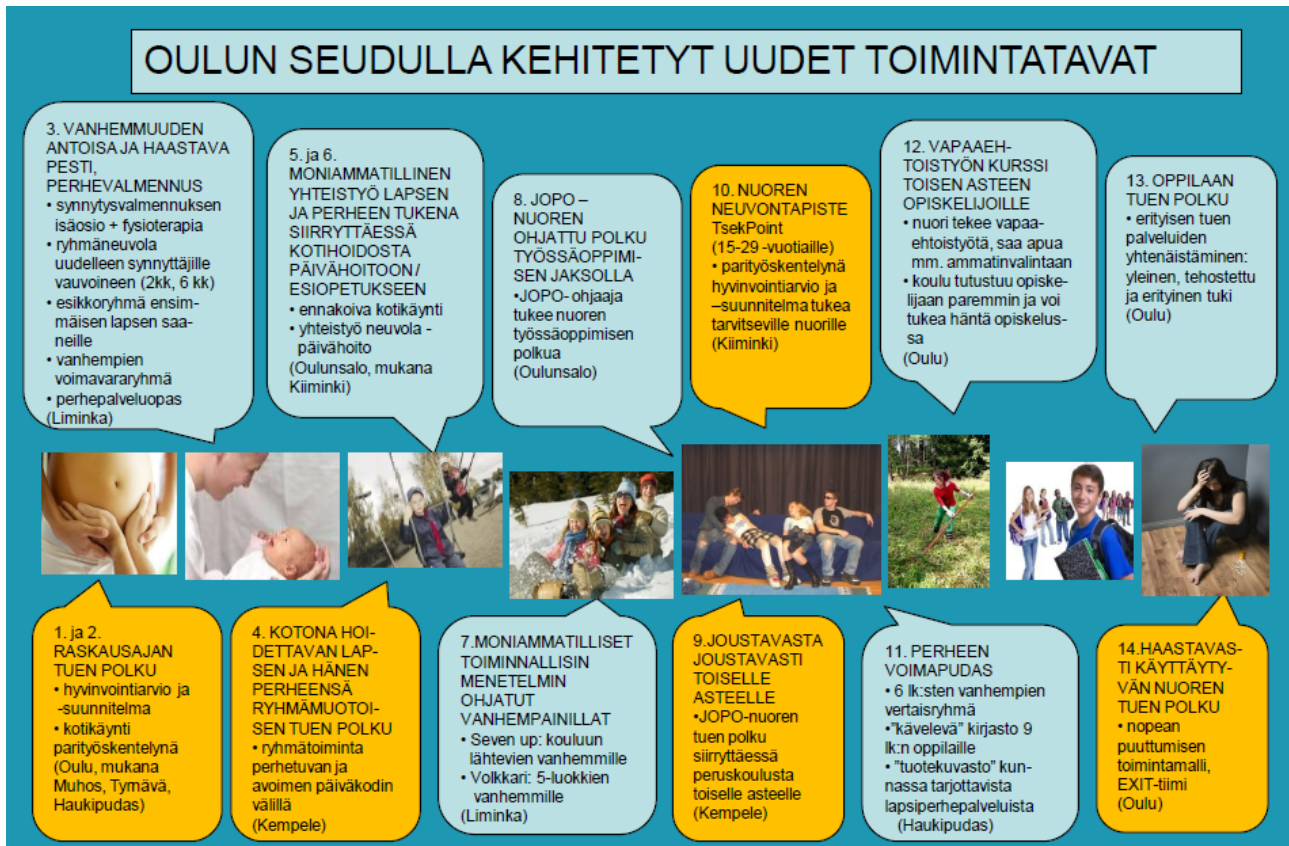
Kuvio 4. Oulun seudulla kehitetyt ja pilotoidut uudet toimintamallit. Oranssilla värillä TUKEVA 2 – jatkohankkeeseen laajemmin juurrutettaviksi valitut viisi toimintamallia.

Kaikista piloteista on laadittu loppuraportit, jotka ovat tämän raportin liitteinä (liite 2).