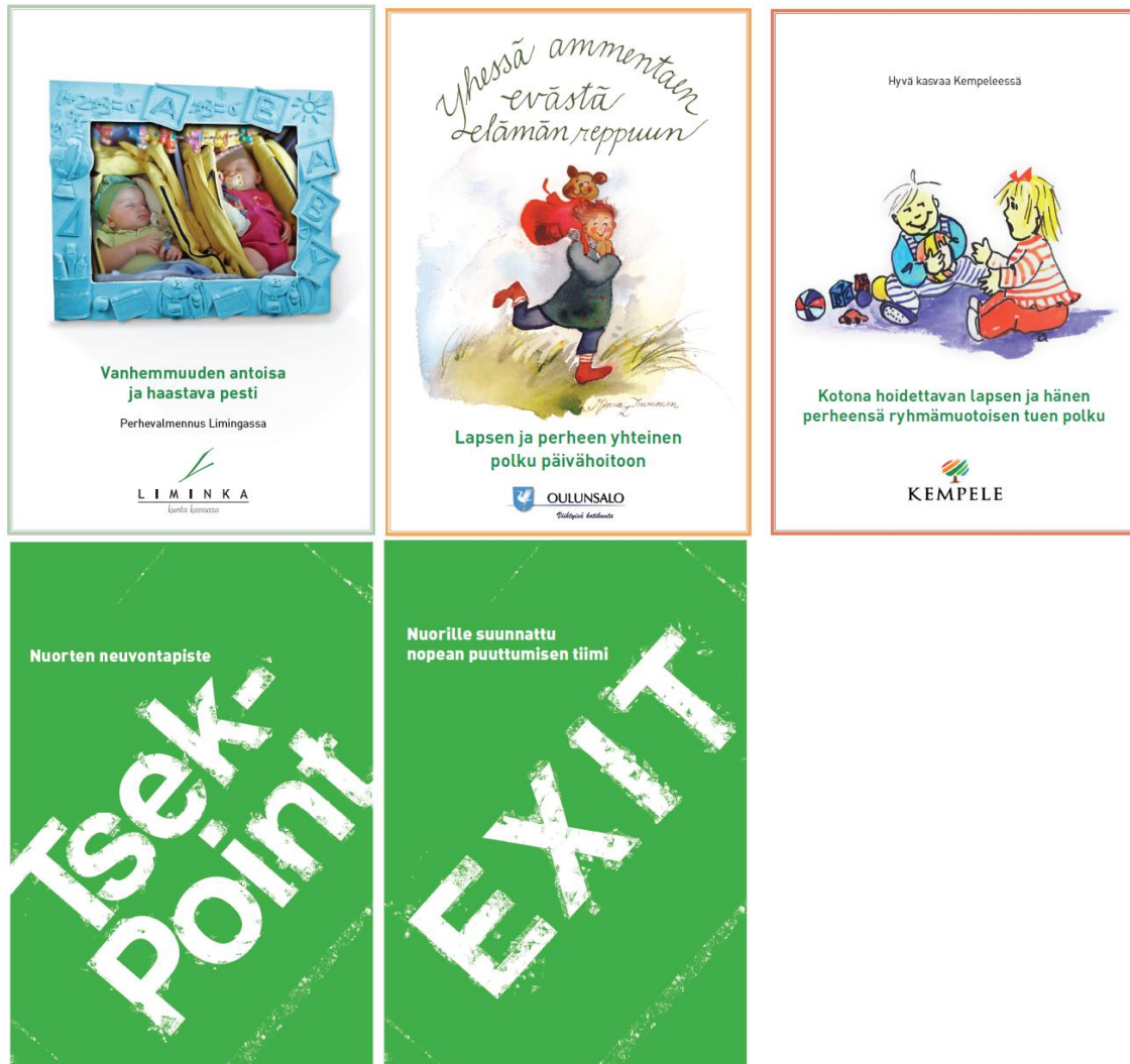
Kuvio 2. Pilottien esitteitä

Pilottien valmisteluvaiheessa tuotettiin tiedottamiseen materiaalia (esitteet, lehtijutut) ja työstettiin pilotoinnissa tarvittavaa materiaalia (esim. hyvinvointiarviointilomakkeita, asiakaspalautelomakkeita, tiedonsiirtolomakkeita, t-paitoja, materiaalikansioita). Prosessien mallinnoista on tehty power point - esittelymateriaalit kuntien käyttöön. Tuotettu kirjallinen materiaali löytyy pilottien loppuraporteista (liite 2). Piloteissa tuotettu materiaali (loppuraportit, lomakkeet, esittelymateriaalit, ym.) on mukana muistitikulla, johon koottiin kattavasti koko TUKEVA-hankealueella, Oulun seudulla, Kainuussa ja Oulunkaarella, tuotettu materiaali.