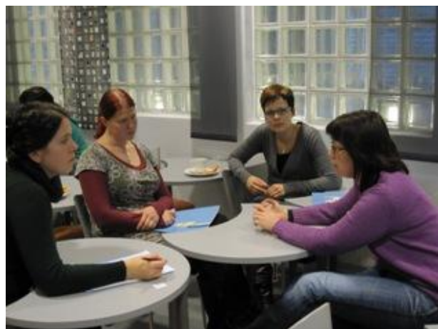
Kuvat 1 ja 2. Moniammatillinen yhteistyö-koulutus Rehapolis-talossa 2009.