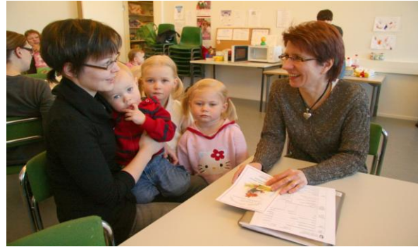
Kuva 3 (vas): Nuoria ”Kävelevässä kirjastossa”.