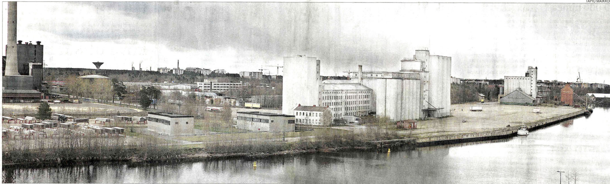
Toppilansalmen länsiranta on Oulun seuraava suuri suunnittelukohde. Sataman kaupallinen toiminta loppuu ensi vuonna ja alue vapautuu asuntorakentamiseen.